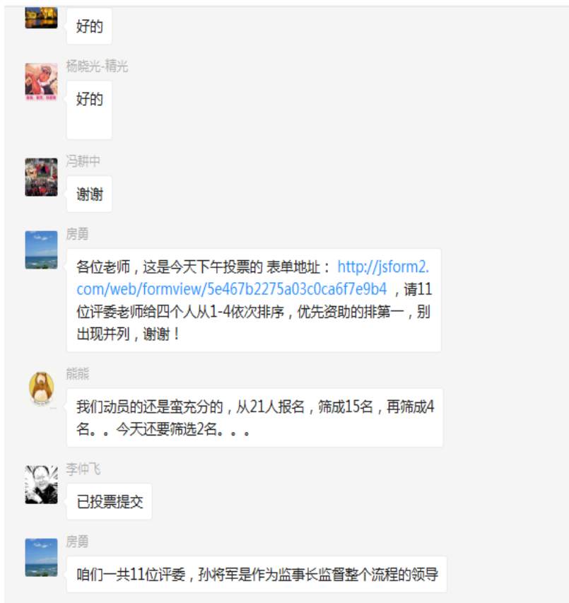
图 5 投票