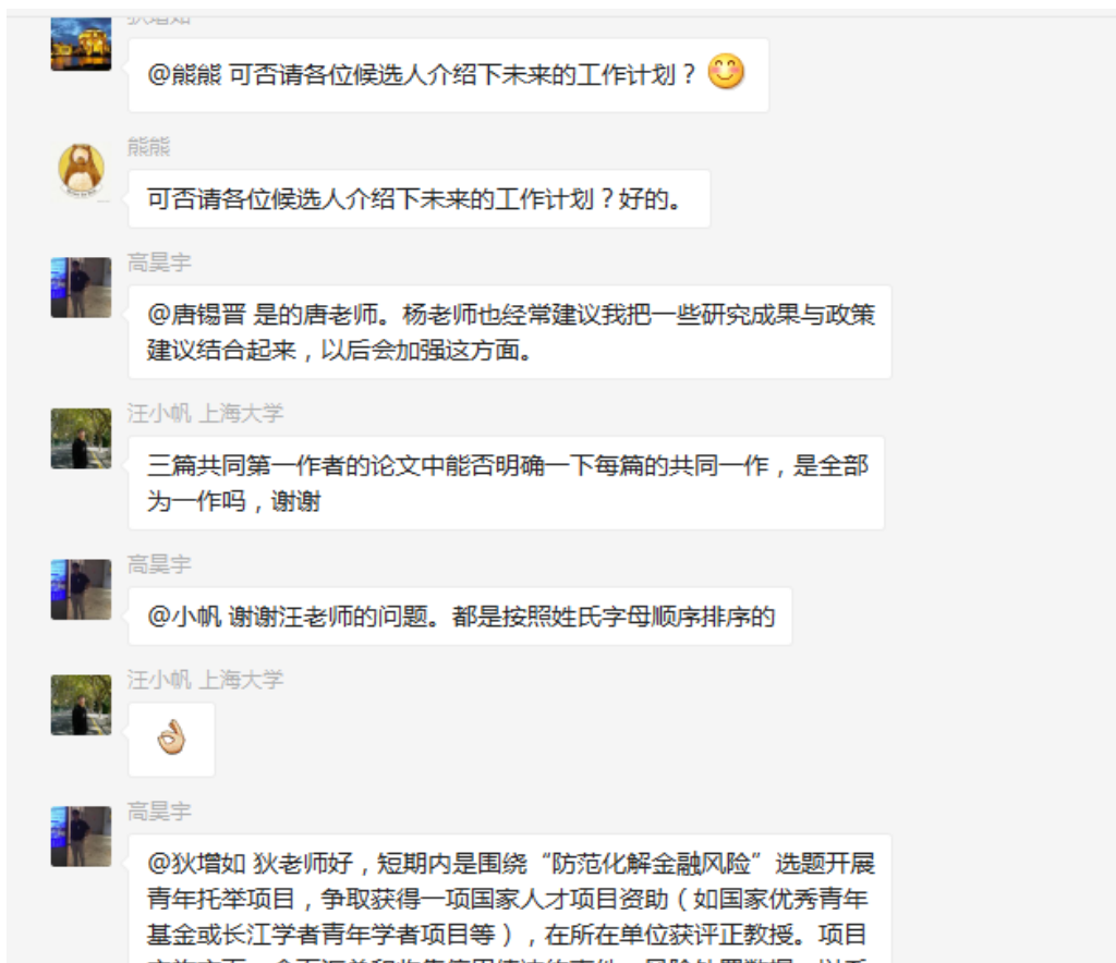
图 3 即时提问及候选人文本回答