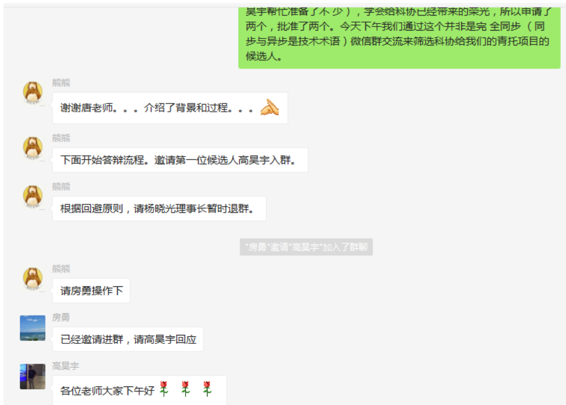
图 2 候选人入群与相关人回避